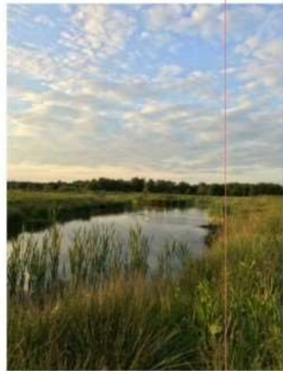
juni 2018

De redactie wenst u een fijne zomerperiode.